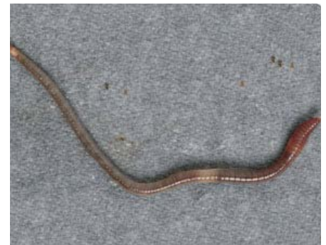
MWYDYN CYNFFON WYTHONGLOG